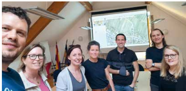
Startschuss Projekt Kellergassenschutzzone