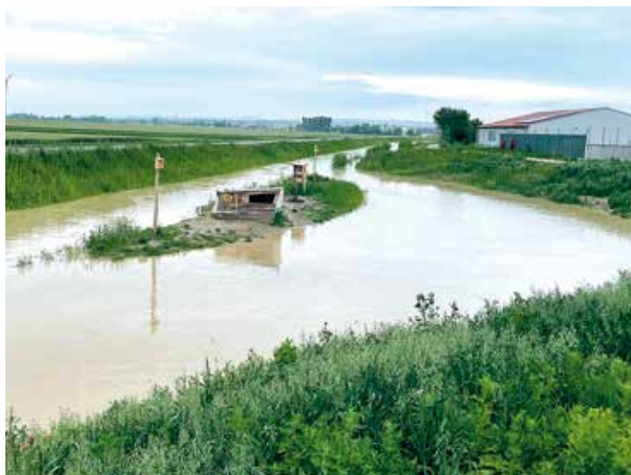
Hochwasser Anfang Juni