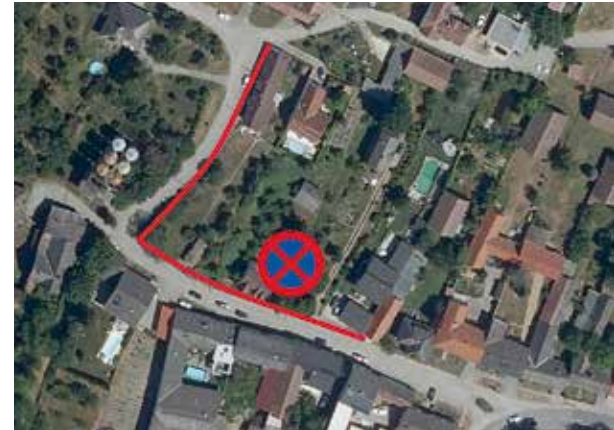
Halte- und Parkverbot „Mühlgasse“