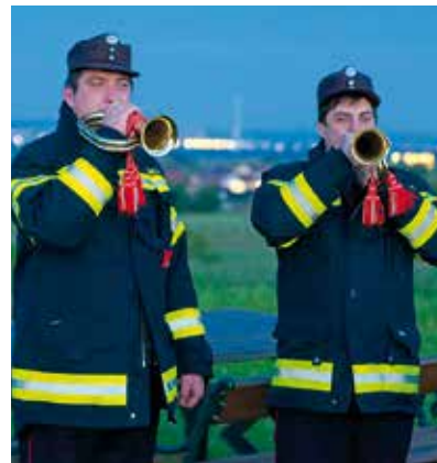
Weckruf zu Floriani

Die jährliche Florianifeier am 05. Mai wurde traditionell mit Klängen aus dem Feuerwehrhorn begonnen, mit dem jede Kameradin und jeder Kamerad geweckt wurde. Über diese außergewöhnliche und schon lange in unserem Ort bestehende Tradition wurde heuer sogar in der Zeitschrift „Brand Aus“ berichtet. Den bisherigen Höhepunkt des Veranstaltungsjahres brachte auch heuer wieder das Oldtimertreffen am 02. Juni. Bestes Wetter und eine gewohnt gute Organisation samt Bewirtung durch uns und zahlreiche weitere Helferinnen und Helfer konnte er-