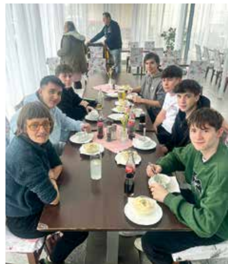
Essen mit den Stellungspflichtigen