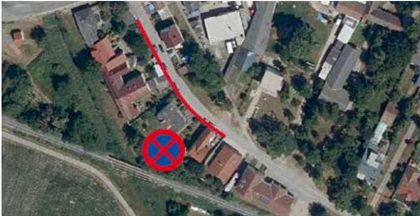
Parkverbot „Am Rußbach“

wenn dieser mit 70 % gefördert würde. Zahlen muss ihn trotzdem jemand.