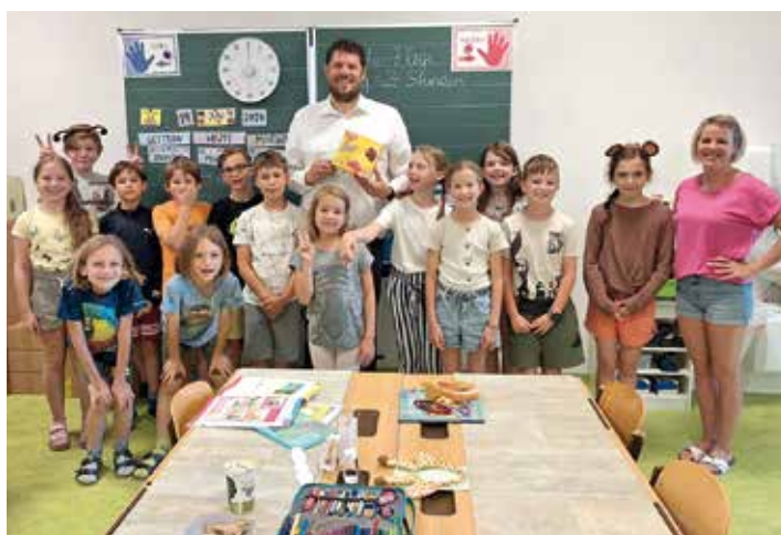
Eis für die Volksschulkinder