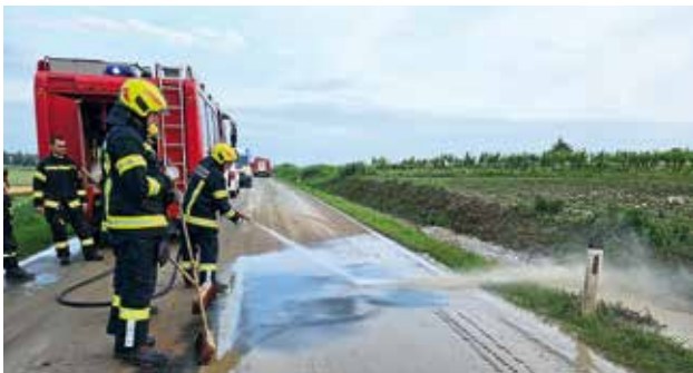
Reinigen der durch Unwetter verschlammten Straße