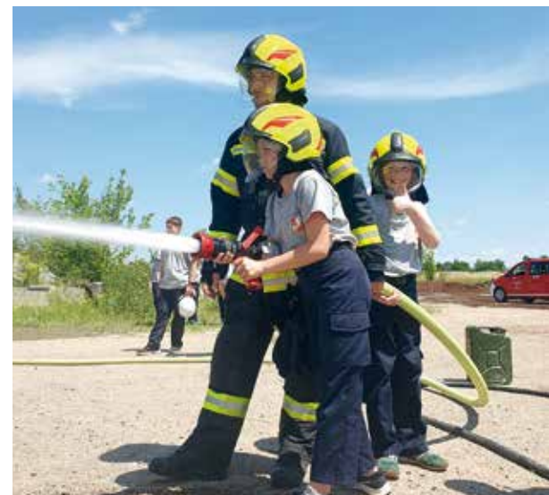
Löschübung der Feuerwehrjugend