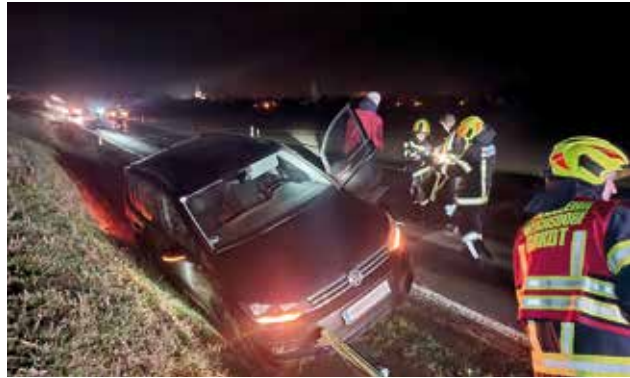
Bergung eines verunfallten PKW