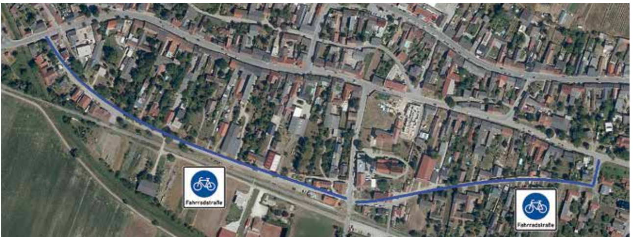
Fahrradstraßen „Am Rußbach“ und „Sechshauserstraße“

Wir ersparen uns (bzw. der Allgemeinheit) damit hohe Kosten für einen zusätzlichen getrennten Geh- und Radweg und zusätzliche Verbauung unseres Grünraumes im Bereich „Am Rußbach“. Auch