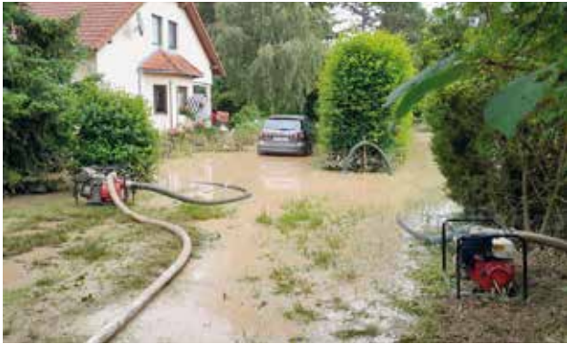
Auspumparbeiten in Unterolberndorf